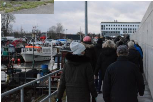
Billeder fra nytårgåturen